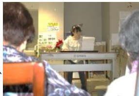
▲新人音楽療法士による演奏を披露♪